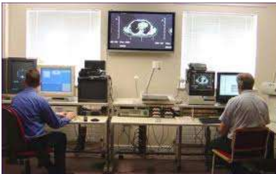
Ambiente usando WorkStation

Um arranjo (conjunto) de WS recebe o nome de Cluster , que utiliza-se de um tipo especial de sistema operacional classificado como sistema distribuído.