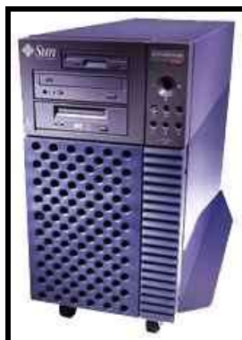
Desktop/RackMount Ultra 10 Solaris Workstations/Servers

É essencialmente um microcomputador projetado para realizar tarefas pesadas, em geral na área científica ou industrial, como complexas computações matemáticas, projetos com auxílio de computação (CAD), processamento de imagem, etc.