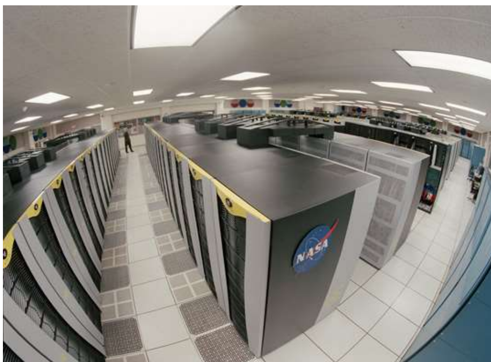
Columbia, o novo (2004) cluster da NASA, 20 Altix clusters executando Linux (10,240 processadores)

O Cluster é construído, muitas vezes, a partir de computadores convencionais ( desktops ), sendo que estes vários computadores são ligados em rede e comunicam-se através do sistema de forma que trabalham como se fosse uma única máquina de grande porte.